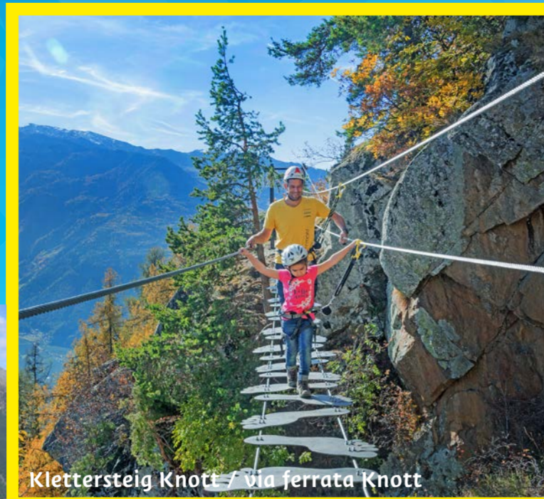
Klettersteig Knott / Via ferrata Knott