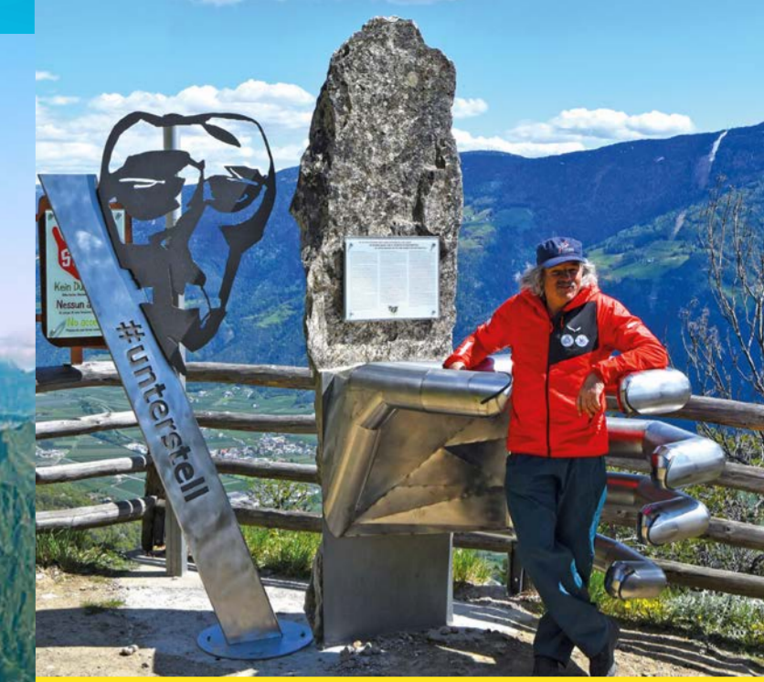
...die Hand vom guten Unterstell Geist