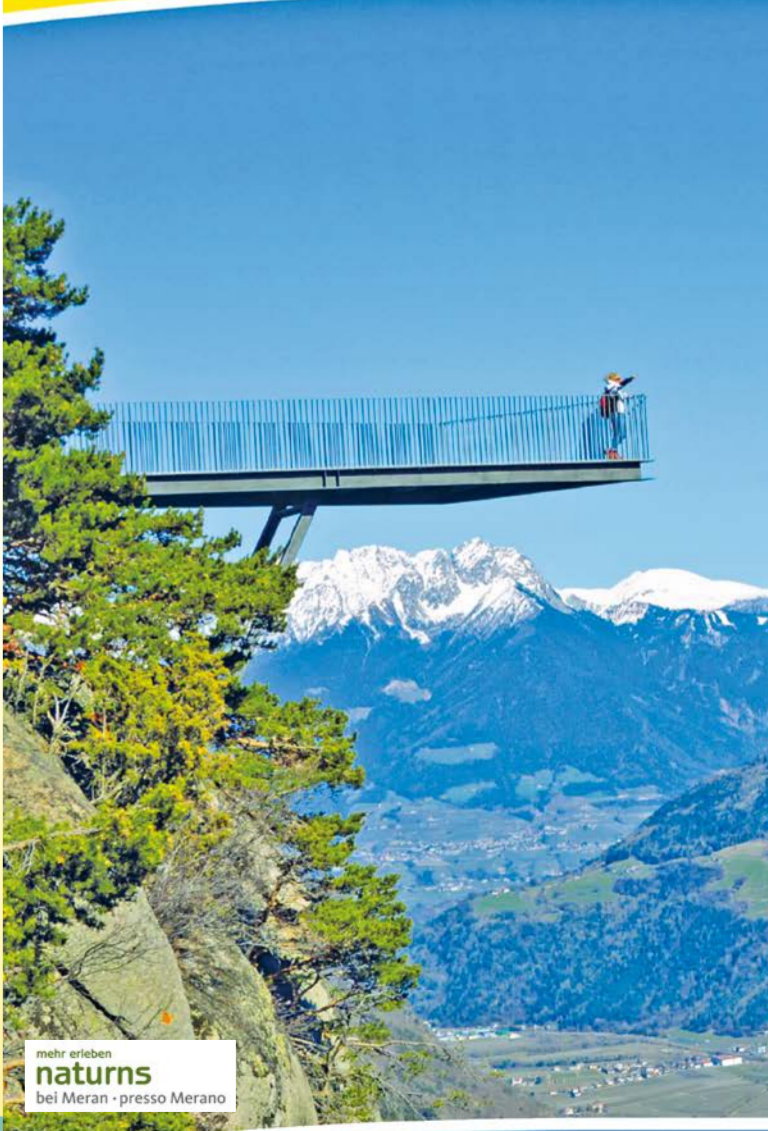
mehr erleben naturns bei Meran - presso Merano

WANDERN AM NATURNSEER SONNENBERG ESCURSIONI SUL MONTE SOLE DI NATURNO Naturns - Naturno | Tel. +39 0473 66 84 18 | www.unterstell.it