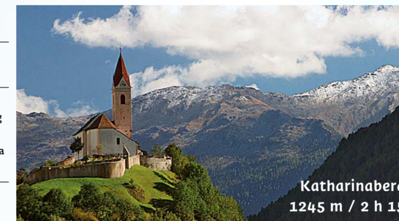
Katharinaberg 1245 m / 2 h 15

Tandemflüge mit dem Gleitschirm Tel. +39 320 74 54 474 www.fly42.it info@fly42.it