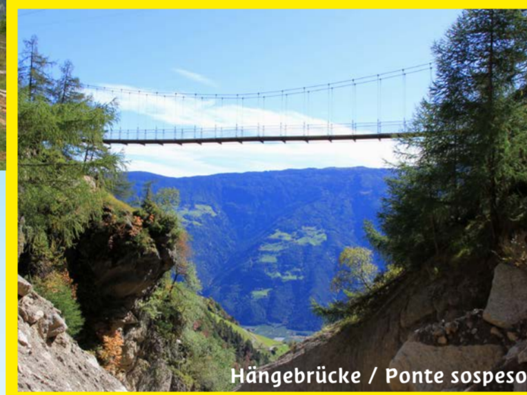
Hängebrücke / Ponte sospeso