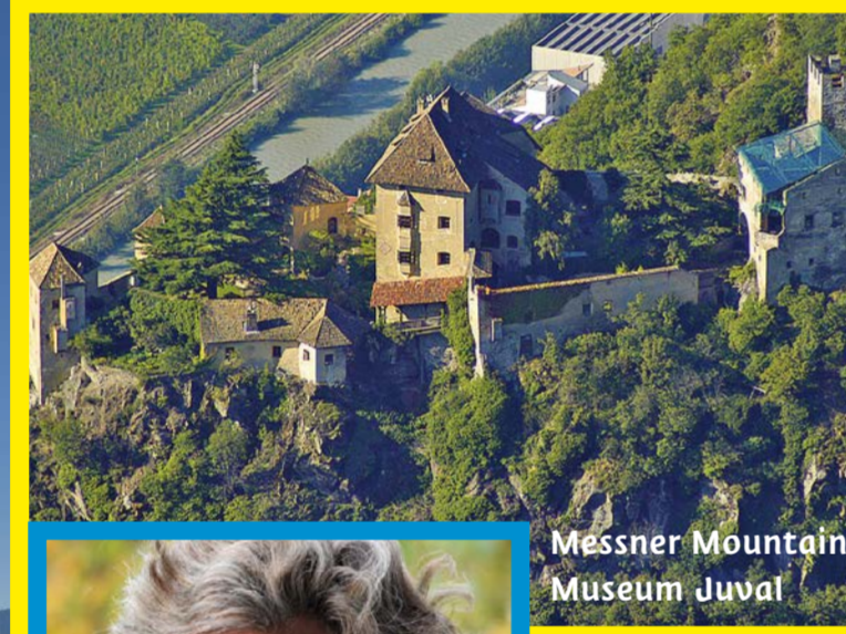
Messner Mountain Museum Juval