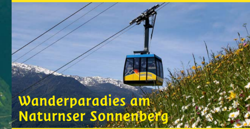
Wanderparadies am Naturner Sonnenberg

Wandern Sie mit Tiroler Herz am Naturner Sonnenberg!