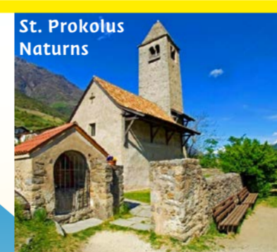
St. Prokolus Naturns